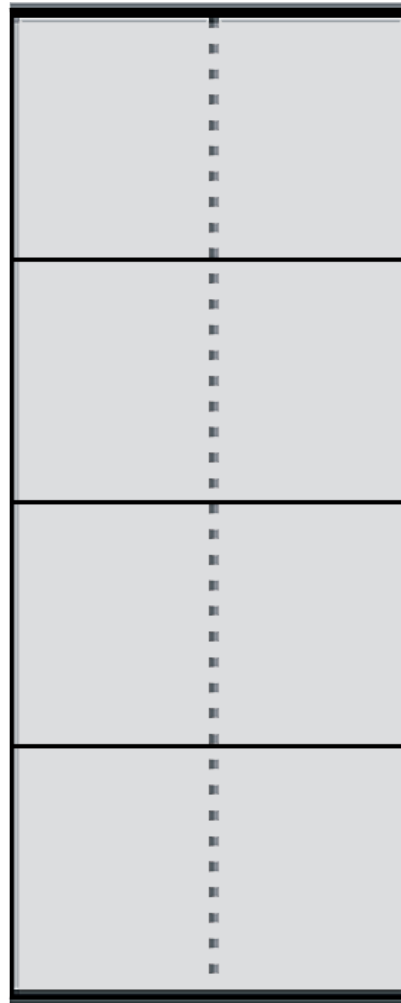
Width 52 cm

DK Brochure holder - enkeltsidet, fleksibel letvægtskonstruktion i aluminium med plads til 8 x A4 brochurer. Ved hjælp af Banner-Line profilen, indsættes netbanneret hurtigt og nemt. Leveres med sort transporttaske.