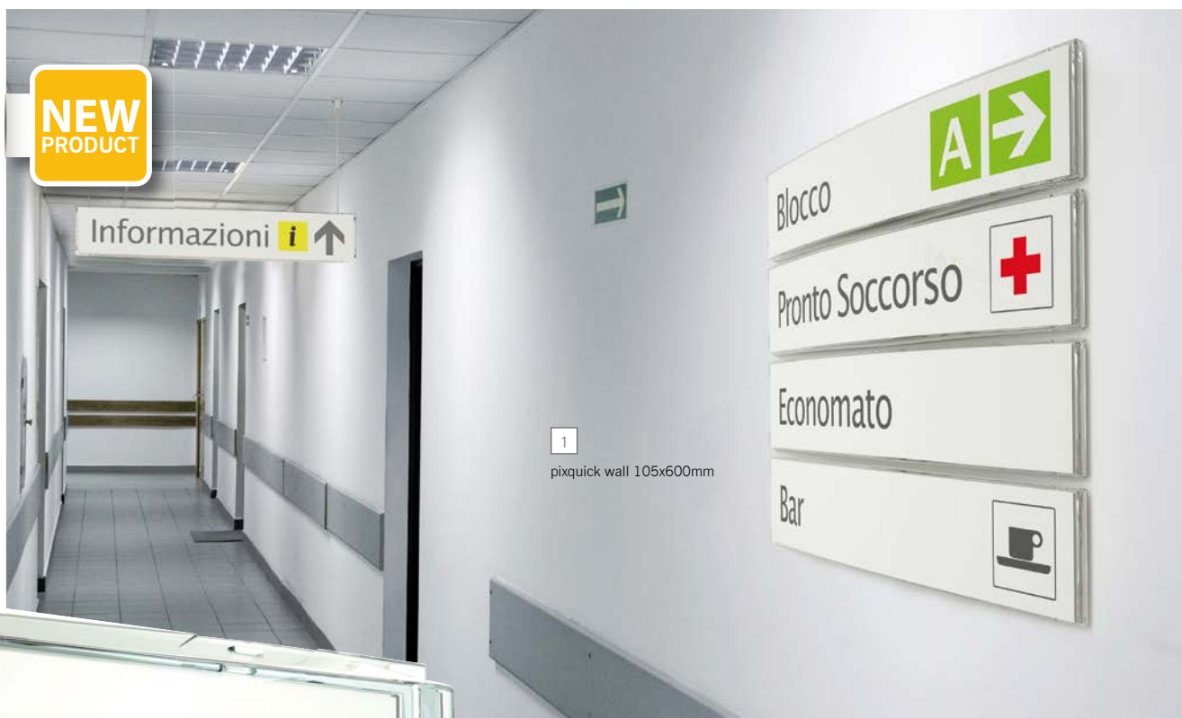
1 pixquick wall 105x600mm